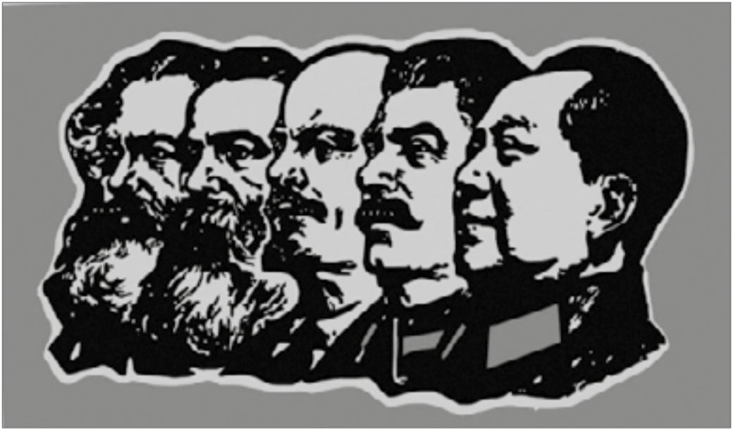
I leader del movimento operaio e socialista: Lenin, Stalin, Mao, Khrushchev, Castro.

ria di lunga durata il cui sviluppo e il cui esito dipendono dalla concezione con cui i comunisti la conducono e dal ruolo che i comunisti assumono; da quanto imparano a essere promotori e costruttori del nuovo potere. A questo proposito sono profondamente sbagliate le tesi di chi sostiene “aspettiamo che passi l'emergenza e poi faremo i conti” (intendendo l'inizio di un ciclo di lotte e di rivendicazioni). Le centinaia di scioperi spontanei delle scorse settimane per fermare la produzione di quelle merci, di quei beni e servizi che non sono essenziali a fronteggiare l'emergenza, dimostrano che la classe operaia è più avanzata di chi sostiene quella tesi. Il Covid-19 non sospende la lotta di classe, anzi la alimenta e la dispiega e rende evidente e urgente la questione della presa del potere politico da parte della classe operaia e delle masse popolari.