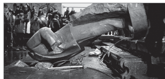
Kiev. La statua di Lenin abbattuta dai manifestanti pro-UE.

Gli affari non vanno bene, anzi vanno sempre peggio. Sono molti i segnali che la crisi e la lotta fra gruppi imperialisti USA e UE si sta acuendo e coinvolge, inevitabilmente le "potenze emergenti" e quelle "calanti", sono anche evidenti, nel senso che non occorre essere fini analisti che cercano fra le righe di articoli, trattati e risoluzioni: dalla guerra delle valute fra USA e Cina (che "mette in mezzo" e lascia indietro l'UE) agli scandali (reiterati e reciproci) dello spionaggio dei capi di stato e manager (con le traversie del pentito Snowden che ha spifferato al mondo il metodo NSA e poi ha cercato rifugio in Russia) che seguono le ondate di fughe di notizie di Wikileaks. Dall'affaire Siria ai contraccolpi della primavera araba, fino alla seconda fase delle rivoluzioni arancioni, tornate alla ribalta con la questione Ucraina. - segue a pag. 2 -